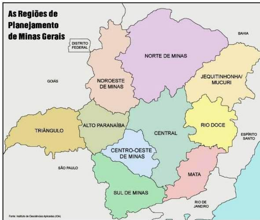
FIGURA 1 REGIÕES DE PLANEJAMENTO DE MINAS GERAIS

Após o Estado de Minas ter vivido anos gloriosos com o ciclo da mineração do ouro, verificou-se no período de 1889-1937 um “crescimento irregular, moderado”, neste período a capital de Minas foi transferida de Ouro Preto para Belo Horizonte, uma cidade planejada. Foi um primeiro esforço na tentativa de articular as regiões do Estado, as quais se encontravam dispersas sobre o vasto território, além da tentativa de apresentar Minas Gerais como sinônimo do progresso na virada do século.